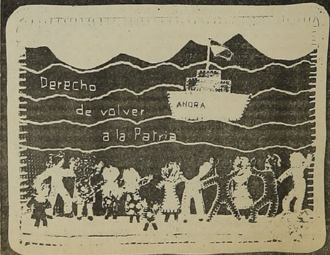
Por Paula Edwards y Antonio de la Fuente