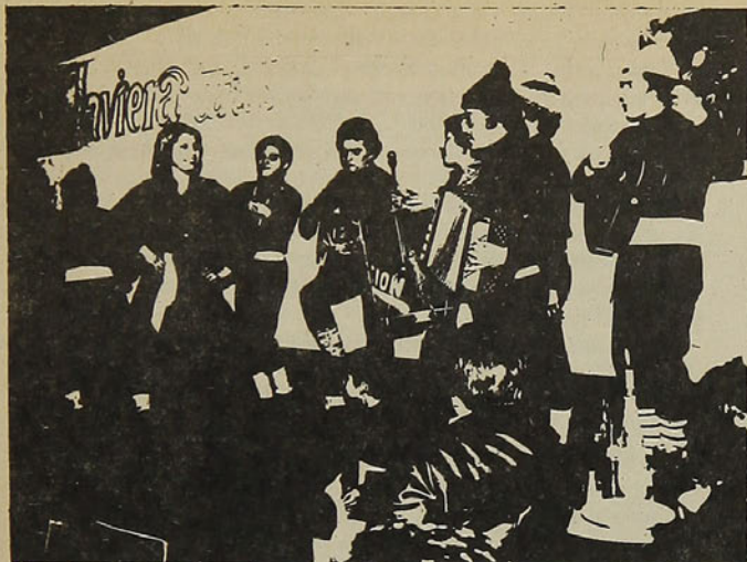
Trasratera chilota: "Tradición" se encarna en escenarios.

Como Departamento Juvenil de la UOC llevan dos años juntos. Los santiaguinos constituyen este grupo de canto y danzas. A los de María Pinto, El Monte, Colina, Pudahuel, San Antonio y Pabellones, se les hace difícil, imposible, venir a los ensayos por falta de dinero. Más tarde los de acá, esperan poder llegar hasta sus pueblos.